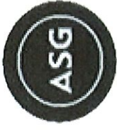
TABLA DE COTIZAR ENMENDADA #1 SUBASTA FORMAL 22J-10310 PARA LA ADQUISICIÓN DE "PORTABLE SCANNERS" PARA LA ADMINISTRACIÓN DE DESARROLLO SOCIOECONÓMICO DE LA FAMILIA DEL GOBIERNO DE PUERTO RICO

GOBIERNO DE PUERTO RICO Administración de Servicios Generales