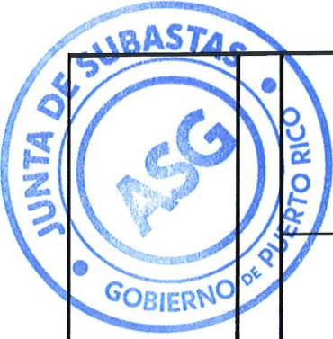
TABLA DE COTIZAR ENMENDADA I SUBASTA 22-0616-R1 PARA ESTABLECER CONTRATO PARA LA ADQUISICION DE PRODUCTOS AGRICOLAS PARA LA ADMINISTRACION PARA EL DESARROLLO DE EMPRESAS AGROPECUARIAS Y TODAS LAS ENTIDADES DEL GOBIERNO DE PUERTO RICO