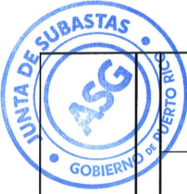
TABLA DE COTIZAR ENMENDADA I SUBASTA 22-0616-R1 PARA ESTABLECER CONTRATO PARA LA ADQUISICION DE PRODUCTOS AGRICOLAS PARA LA ADMINISTRACION PARA EL DESARROLLO DE EMPRESAS AGROPECUARIAS Y TODAS LAS ENTIDADES DEL GOBIERNO DE PUERTO RICO