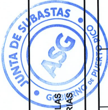
TABLA DE COTIZAR ENMENDADA I SUBASTA 22-0616-R1 PARA ESTABLECER CONTRATO PARA LA ADQUISICION DE PRODUCTOS AGRICOLAS PARA LA ADMINISTRACION PARA EL DESARROLLO DE EMPRESAS AGROPECUARIAS Y TODAS LAS ENTIDADES DEL GOBIERNO DE PUERTO RICO