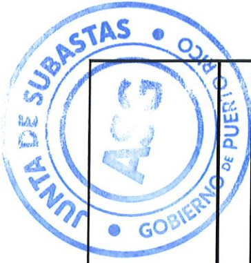
TABLA DE COTIZAR ENMENDADA I SUBASTA 22-0616-R1 PARA ESTABLECER CONTRATO PARA LA ADQUISICION DE PRODUCTOS AGRICOLAS PARA LA ADMINISTRACION PARA EL DESARROLLO DE EMPRESAS AGROPECUARIAS Y TODAS LAS ENTIDADES DEL GOBIERNO DE PUERTO RICO