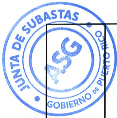
TABLA DE COTIZAR ENMENDADA I SUBASTA 22-0616-R1 PARA ESTABLECER CONTRATO PARA LA ADQUISICION DE PRODUCTOS AGRICOLAS PARA LA ADMINISTRACION PARA EL DESARROLLO DE EMPRESAS AGROPECUARIAS Y TODAS LAS ENTIDADES DEL GOBIERNO DE PUERTO RICO