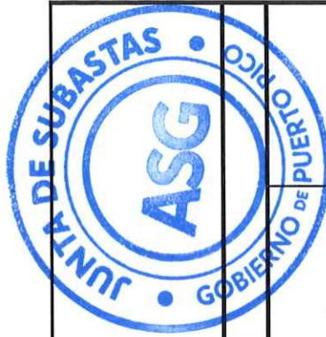
TABLA DE COTIZAR ENMENDADA I SUBASTA 22-0616-R1 PARA ESTABLECER CONTRATO PARA LA ADQUISICION DE PRODUCTOS AGRICOLAS PARA LA ADMINISTRACION PARA EL DESARROLLO DE EMPRESAS AGROPECUARIAS Y TODAS LAS ENTIDADES DEL GOBIERNO DE PUERTO RICO