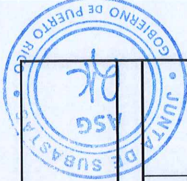
TABLA PARA COTIZAR - REGION ARECIBO