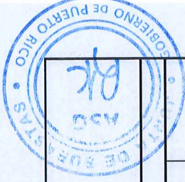
TABLA PARA COTIZAR - REGION CAGUAS