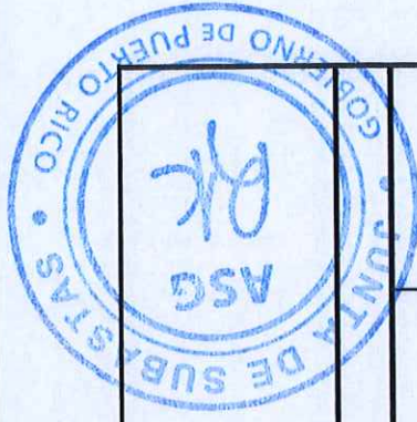
TABLA PARA COTIZAR - REGION BAYAMON