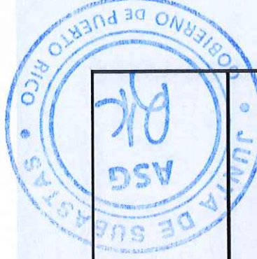
TABLA PARA COTIZAR -REGION MAYAGUEZ