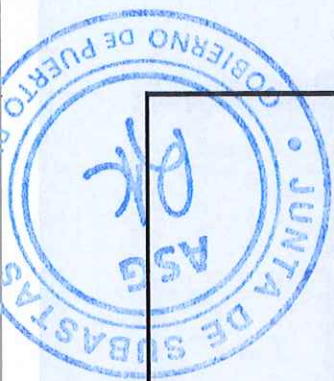
TABLA PARA COTIZAR -REGION MAYAGUEZ