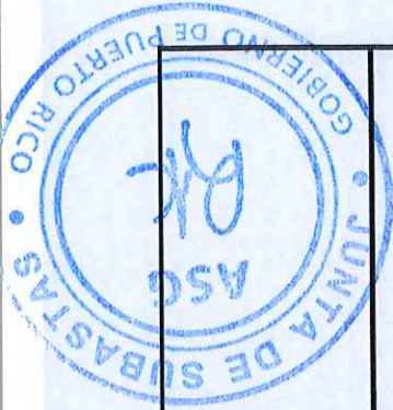
TABLA PARA COTIZAR - REGION ARECIBO