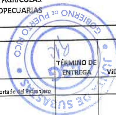
TABLA PARA COTIZAR - REGION HUMACAO