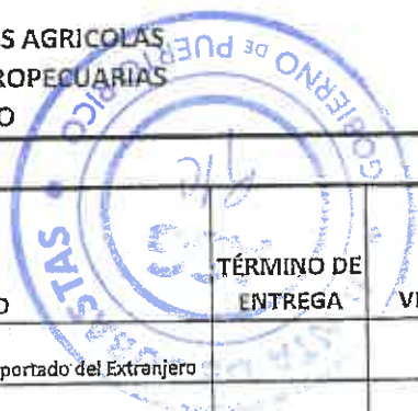
TABLA PARA COTIZAR - REGION SAN JUAN