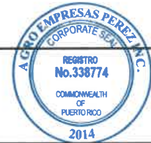
TABLA PARA COTIZAR -REGION MAYAGUEZ