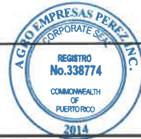
TABLA PARA COTIZAR - REGION CAGUAS