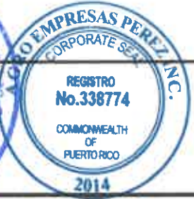
TABLA PARA COTIZAR - REGION PONCE