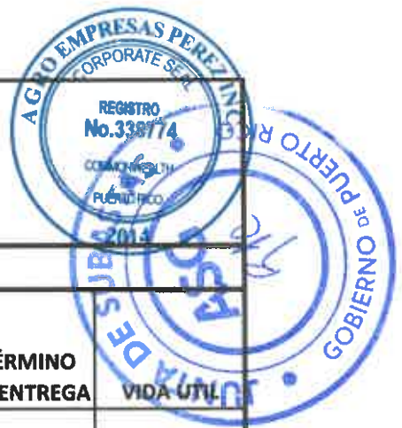
TABLA PARA COTIZAR - REGION ARECIBO