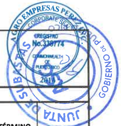
TABLA PARA COTIZAR - REGION ARECIBO