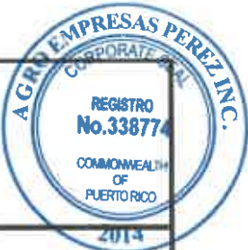
TABLA PARA COTIZAR - REGION SAN JUAN