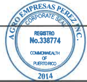
TABLA PARA COTIZAR - REGION HUMACAO