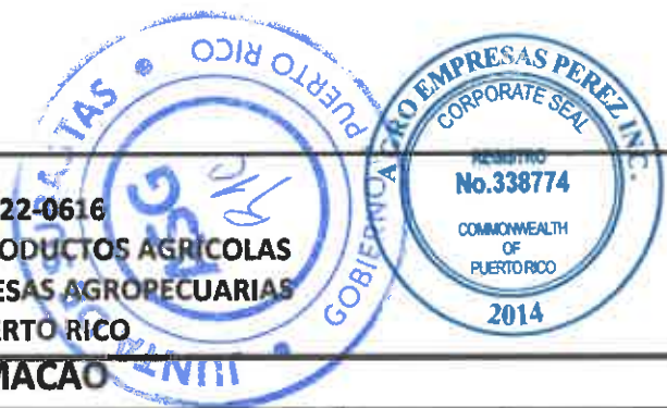
TABLA PARA COTIZAR - REGION HUMACAO