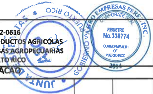
TABLA PARA COTIZAR - REGION HUMACAO