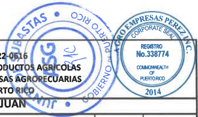
TABLA PARA COTIZAR - REGION SAN JUAN