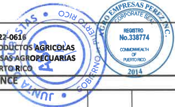
TABLA PARA COTIZAR - REGION PONCE