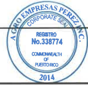
TABLA PARA COTIZAR - REGION CAGUAS